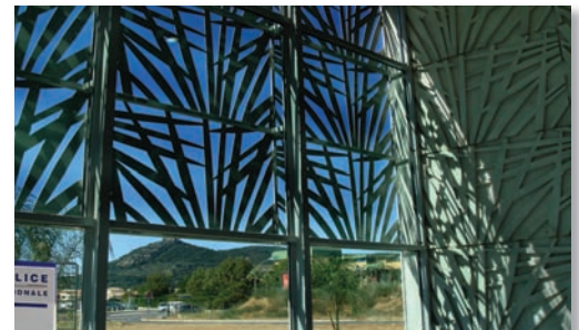
Commissariat de Police à Hyères (83) / SGAP de Marseille / Conception : ILR & Christophe Caire Architecture